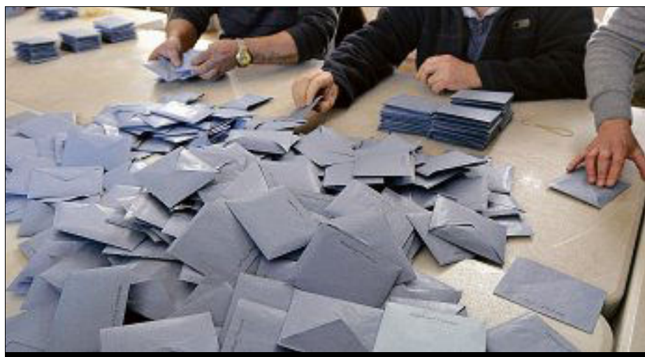
SCRUTINS LES 11 ET 18 JUIN. Un peu plus de 83.000 électeurs sont appelés aux urnes dans la première circonscription pour élire leur nouveau député.

Deux élus socialistes. Les socialistes font figure d'héritiers dans cette circonscription qui leur était historiquement acquise (voir ci-dessous), mais ils