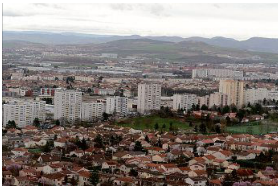
CLERMONT NORD. La première circonscription est celle de Clermont et du nord de l'agglomération, auxquels s'ajoute Cournon, la deuxième ville du Puy-de-Dôme, soit un bassin total d'environ 140.000 habitants.

D'importantes zones d'activités et industrielles sont sur cette circonscrip-